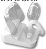
Cuerpo del aparato